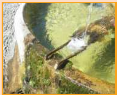
La fontaine ronde à Valensole

Les villageois furent souvent contraints, jusqu'au XVe siècle, d'aller puiser l'eau loin de leurs maisons. Il s'agit, quand l'habitat est perché, d'une source en contrebas du relief. On a creusé des puits en zone de plateaux.