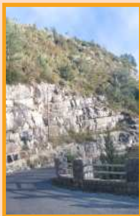
La route des crêtes

Le XIXe siècle est caractérisé par l'aménagement de nouvelles voies de communication, alors que la région connaît surtout des chemins muletiers. Une seule route carrossable, celle d'Aix-en-Provence à Digne via Riez, traverse le Verdon en 1830. Le grand axe de la partie orientale est aménagé dans les décennies qui suivent, c'est la nationale 85 qui mène de Digne à Grasse par Barrême, Saint-André et Castellane.