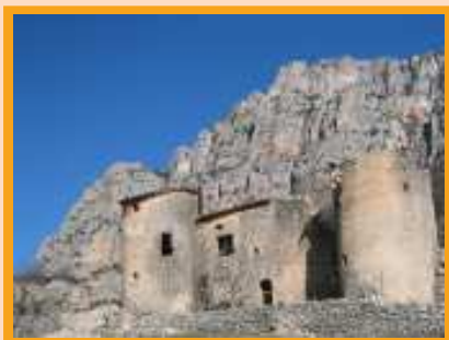
Le château de Meyreste

La région souffre des troubles socio-économiques du XVe siècle, certains fiefs sont désertés et les communautés voisines se partagent alors leurs territoires. La Palud occupe le terroir de Meyreste, Comps et Trigance se partagent celui d'Estelle et Rougon annexe celui d'Entreverges. La majeure partie d'entre eux se repeuple mais, devenus simples hameaux, ils sont rattachés à un fief voisin : c'est le cas du Castellet à Allemagne, du Bars et de Villedieu à Valensole, de Troins à Saint-André-les-Alpes, de la Roquette à Montmeyan, de Mauroué à Riez, de Saint-Barthélémy à Bauduen, etc.