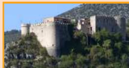
Le château de Trigance

D'autres, comme Brenon en 1492, vont bénéficier d'un acte d'habitation passé entre le seigneur local et un groupe de familles postulant à l'occupation des lieux. Artignosc aurait été repeuplé par des Génois et des Espagnols, Régusse par des Magyars. D'autres communautés ne se relèveront qu'au XVIIe siècle, comme Villeneuve-Coutelas à Régusse. La région connaît bientôt une nouvelle poussée démographique. Les agglomérations débordent largement de leurs remparts. Un faubourg, généralement nommé la Bourgade, s'implante en contrebas du quartier médiéval ou hors de la ville. Les maisons, comme les rues et les places, y sont plus vastes, plus confortables.