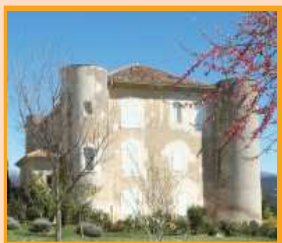
Le château de Saint-Laurent-du-Verdon

L'austérité architecturale des siècles précédents, liée à la fonction défensive des bâtiments, s'atténue puis est abandonnée. Les tours d'angle, quand elles ne disparaissent pas, se font éléments de décor et se détachent peu à peu de la façade. Les ouvertures de façades abondent : fenêtres à meneaux au XVI e , larges baies cintrées aux siècles suivants.