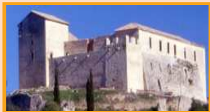
Le château de Gréoux-les-Bains

La romanisation du pays s'opère par assimilation des populations indigènes. Elle induit un changement radical par son organisation sociale et administrative et structure les voies de communication. C'est le triomphe de l'urbanisation, elle reste cependant très limitée dans le Verdon. Riez, la puissante cité des Reii Apollinaris - en est le prototype, elle s'est implantée au carrefour d'itinéraires de première importance. Gréoux et Salinae-Castellane possèdent d'importantes sources particulières : sulfureuse pour la première, salée pour la seconde.