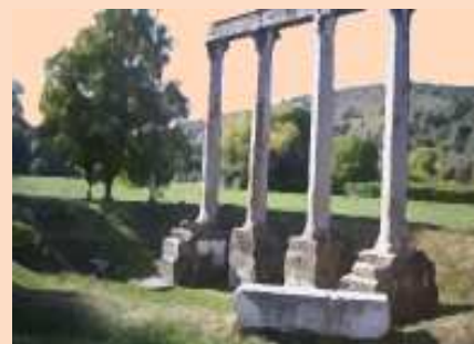
Les quatre colonnes de Riez

Qui dit portiques dit colonnes. Elles furent réemployées au Haut Moyen-Âge en de nombreux lieux de la ville : dans l'église du couvent des Cordeliers fondé au XIII e siècle aujourd'hui détruit, dans l'église Saint-Maxime, attestée dès le Xe siècle (elle contenait six colonnes à l'intérieur et deux à l'entrée), une autre constitue une croix de mission près du baptistère, une dernière celui d'une fontaine.