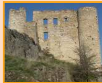
Le château de Bargème

Mais chaque lieu, chaque village en conservent encore des traces, comme la chapelle ruinée de St-Martin, à La Garde, qui marque l'emplacement du village médiéval, sur les escarpements du Teillon, et la chapelle de La Ville à Peyroules, qui joue le même rôle, ou encore la chapelle Ste-Anne du Bourguet, édifiée au début du XIIIe siècle et dont la porte rappelle celle de l'église St-Victor de Castellane.